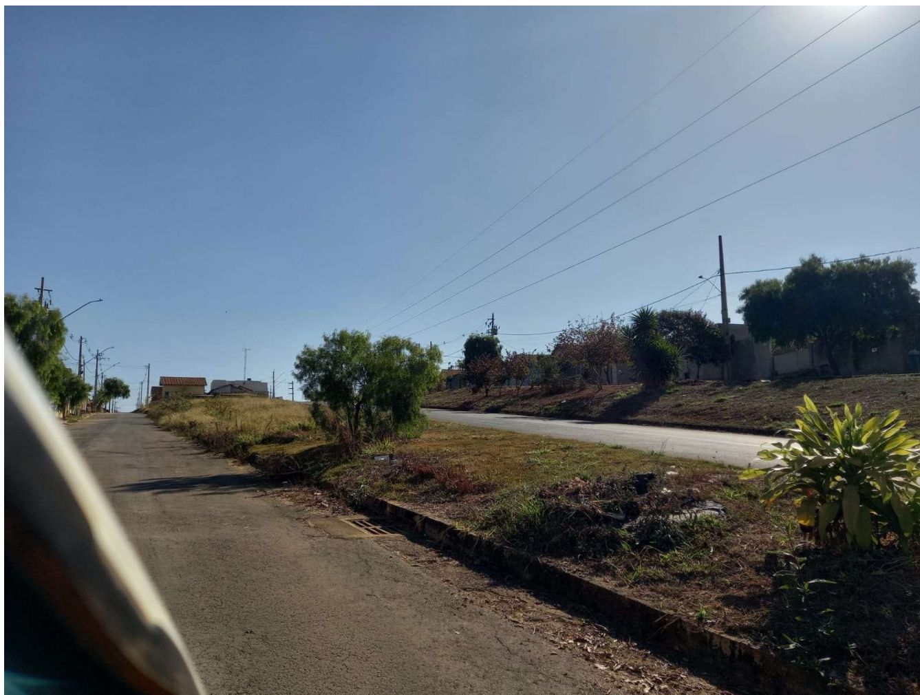
04-FOTO LATERAL DIREITA DO TERRENO (RUA ANTONIETA MAROQUE DA SILVA)