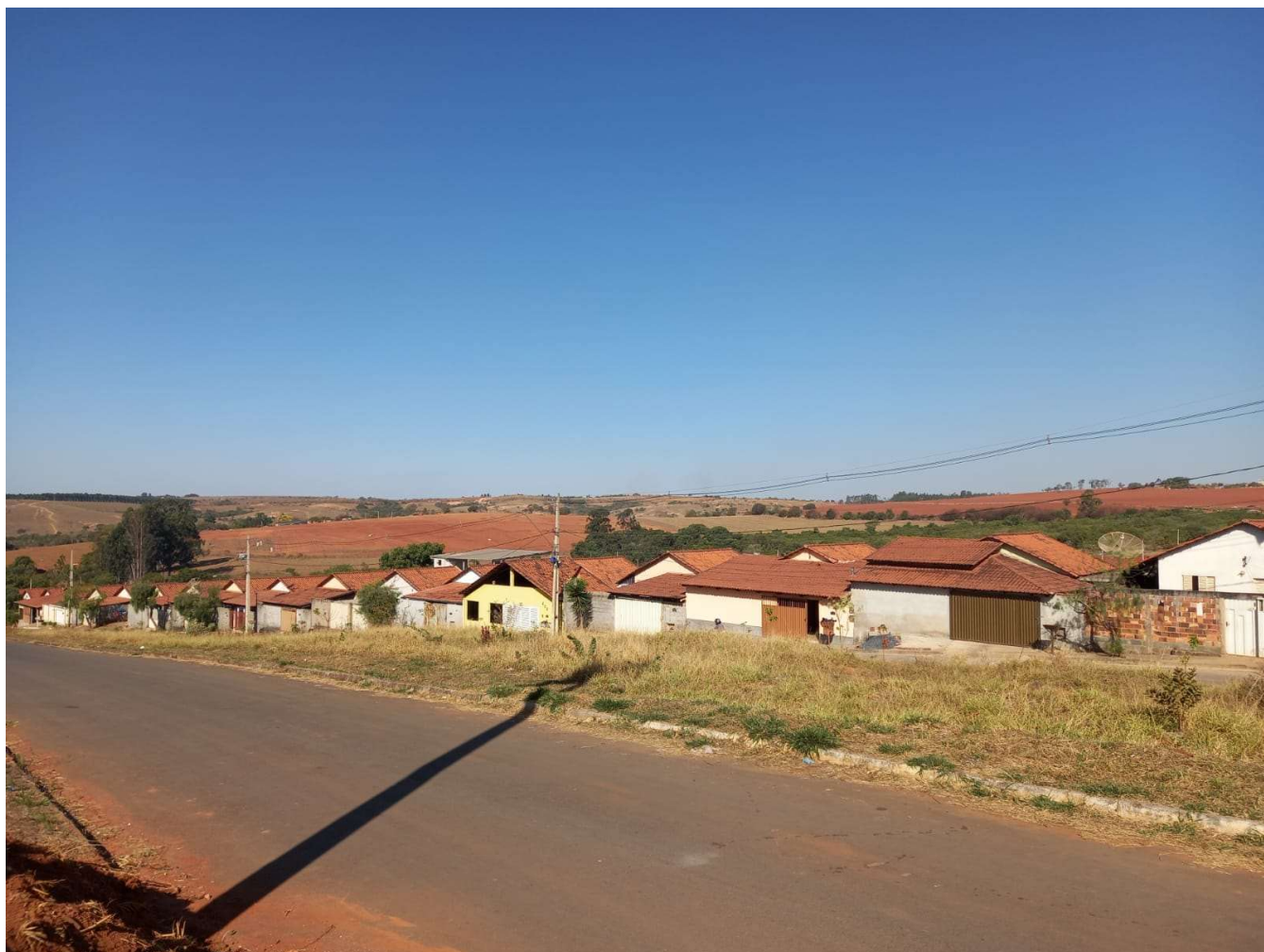
03-FOTO LATERAL ESQUERDA DO TERRENO (RUA NEYSSON PAULINELLI DE OLIVEIRA)

SECRETARIA MUNICIPAL DE OBRAS, URBANISMO E SERVIÇO PÚBLICO.